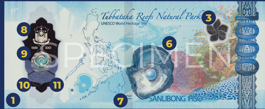
Disenyo sa likod: Tubbataha Reefs Natural Park (UNESCO World Heritage Site), South Sea Pearl ( Pinctada maxima ), ug T'nalak weave design