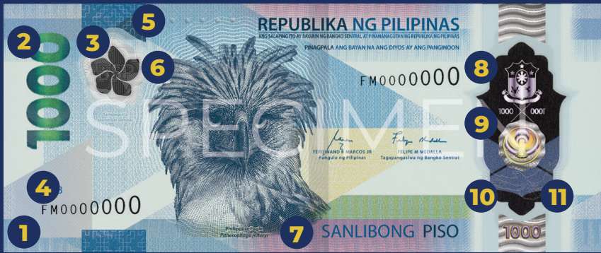
Disenyo sa atubangan: Philippine Eagle ( Pithecophaga jefferyi ) ug Sampaguita ( Jasminum sambac )